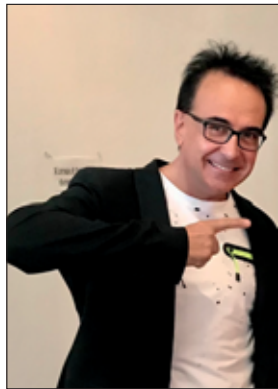
a cura di Angelo Martini Conduttore - Musicista Giornalista Televisivo e Musicale

Grande successo del Piotta tornato in un concerto davanti a più di duemila persone a Roma venerdì 22 settembre nella bellissima Villa Ada Festival, per una grande festa di chiusura a ingresso gratuito: "Tutti a... Funk". Un' affluenza davvero entusiasmante per una serata all'inizio piovosa, ma la forza della musica vince sempre, con ritmi e musiche super coinvolgenti. Tommaso Zanella canta e rappa bene lui è il maestro, lo ha inventato lui in Italia, uno dei primi e primo resta, per la sua grande onesta intellettuale, cultura trasversale non solo musicale. Si sente dai suoi testi che ancora oggi suonano innovativi, con una band sincronizzata nel feel e nello stile, con una dinamica niente da invidiare al tour colossali americani e non, considerando l'essenzialità dei componenti veri maestri. La gente balla si diverte ma soprattutto gode del passato senza dimenticare il presente quando il Piotta fa vedere che la musica è solo una, quella del cuore e della coerenza e serietà musicale. Dopo la recente pubblicazione del