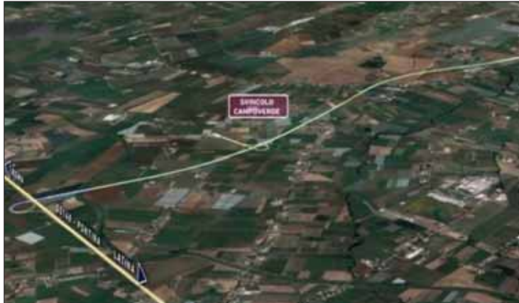
Bretella svincolo Aprilia