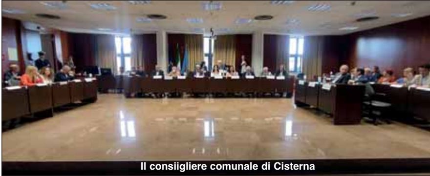
Il consigliere comunale di Cisterna