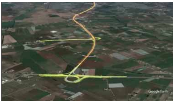
Svincolo Pontina - Campoverde