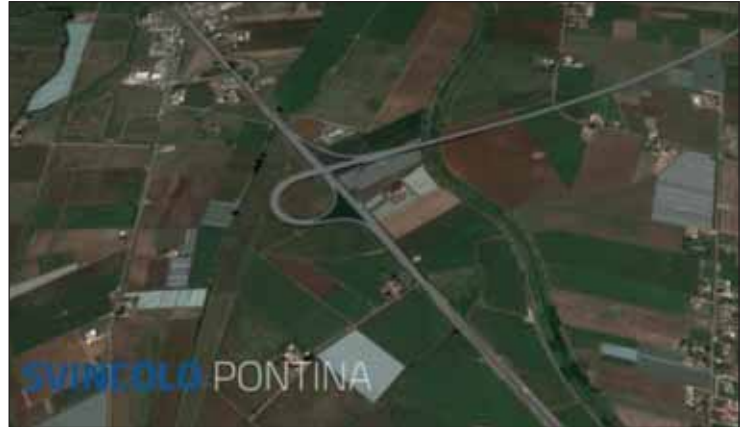
Bretella svincolo Pontina