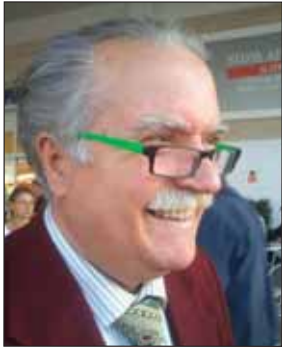
di Salvatore Lonoce