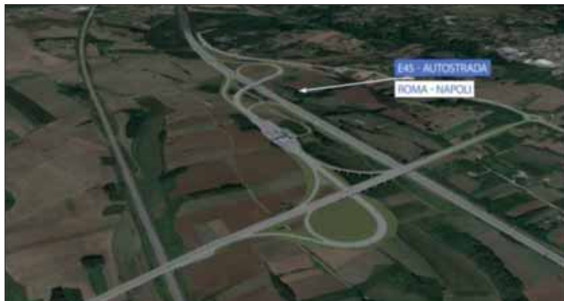
Svincolo sulla Roma - Napoli