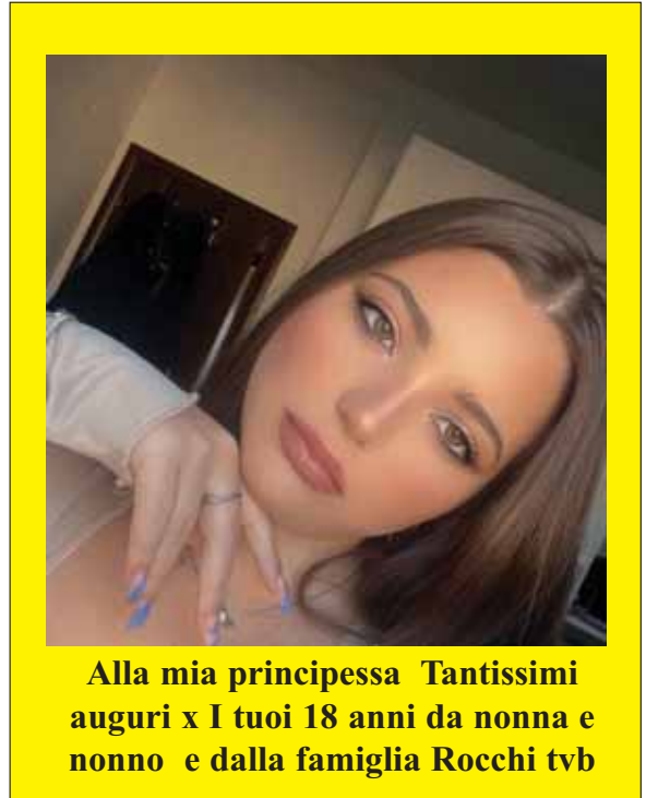
Alla mia principessa Tantissimi auguri x I tuoi 18 anni da nonna e nonno e dalla famiglia Rocchi tvb