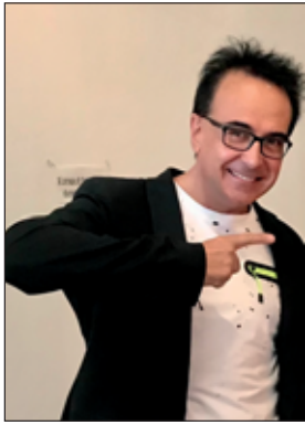
a cura di Angelo Martini Conduttore - Musicista Giornalista Televisivo e Musicale