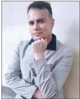
di Luca Leurini

Durante le vacanze ci rilassiamo, il nostro corpo si riposa dalle fatiche invernali e finalmente ci godiamo il caldo massaggio del sole accompagnato da un tuffo in acqua.