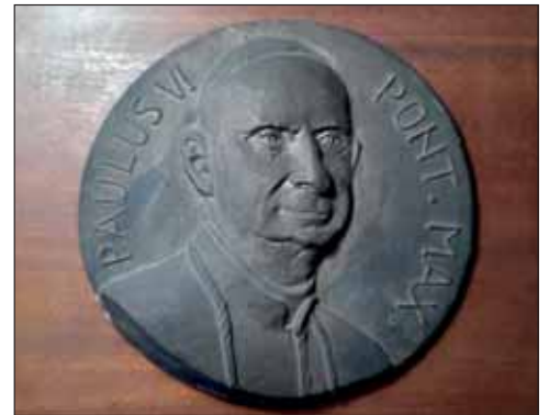
il bozzetto in bronzo della medaglia originale in basso gesso dorato utilizzato per il bronzo donato al papa