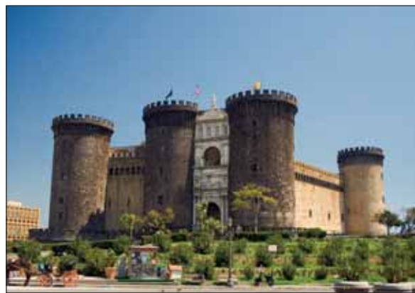
Napoli - Il Castello del Maschio Angioino