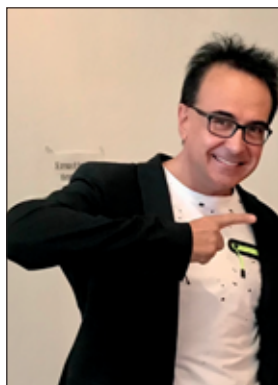
a cura di Angelo Martini Conduttore - Musicista Giornalista Televisivo e Musicale