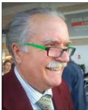
di Salvatore Lonoce

Cari lettori, Aprilia è un paese dalle profonde contraddizioni, dove convivono straordinarie capacità creative e un radicato senso di frustrazione sociale. Questo dualismo si manifesta in molti ambiti, ma uno dei più emblematici è il sentimento dell'invidia tipo: