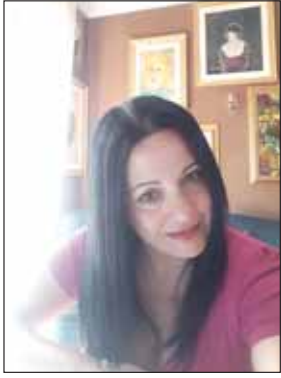
di Antonella Bonaffini

vicende legate alla sua famiglia di origine, conoscerà la prima clinica psichiatrica. Espulso dall'istituto svizzero, tenterà di ricongiungersi alla famiglia adottiva, vivendo con la madre un rapporto intenso ma altalenante. La stessa, stanca della sua inquietudine, nel 1919 presenterà una denuncia che gli provocherà l'espulsione. Con pochi soldi in tasca, inizierà una vita selvaggia, tra le golene del po. In questi luoghi inizierà a lavorare l'argilla, con una padronanza che saprà dell'incredibile poiché completamente autodidatta. L'incontro con Marino Mazzacurati lo inserirà nel mondo pittorico romano. Ligabue dipinge, iniziando a farsi notare e barattando spesso le sue opere con un piatto caldo. I gesti di autolesionismo lo renderanno oggetto di vari ricoveri. Nel 1948 il suo nome inizierà a circolare tanto da destare l'interesse della critica e dei