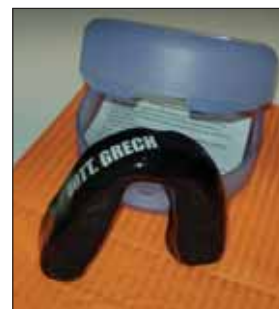
cervicale infine aumenta

sempre più rischiose. Si indossano nei vari sport il casco e le ginocchiere. Il paradenti completa gli accorgimenti di protezione da trauma non solo per i denti e la gengiva ma anche per le labbra, la lingua e l'osso mascellare. Inoltre ammortizza gli urti e attutisce le commozioni cerebrali. Il paradenti è un prodotto di qualità fatto in collaborazione tra odontotecnici qualificati ed Odontoiatra. È un dispositivo che consente di parlare, bere e respirare senza alcun disagio.